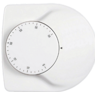
78mm x 85mm x 34mm

El Termostato mecánico de ambiente Euterma HT-03 está diseñado para proporcionar control automático para el actuador térmico, válvulas de control eléctrico, etc. en instalaciones de calefacción. Los usuarios consiguen una calefacción más cómoda y económica ajustando la temperatura según las necesidades.